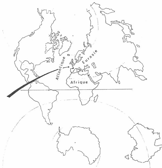
Fig. 1 — A l'échelle du globe.

Elle occupe ainsi une position clé à la jonction de l'Europe continentale (la France), de l'Europe péninsulaire occidentale (l'Espagne) et de l'Océan (le Golfe de Gascogne).