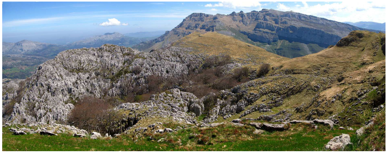
Le lapiaz de la Peña Lavalle et le sommet herbeux qui domine la vallée d'Asòn (au centre de la photo).