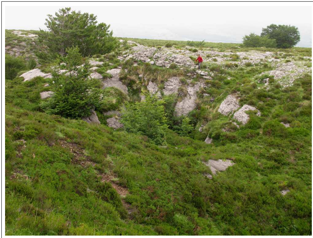
La torca de Bedulosa s'ouvre au fond de cette doline envahie par la végétation.