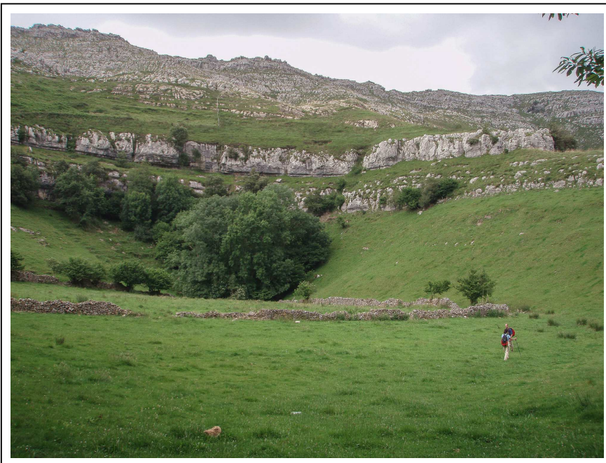
◁ Sumidero de Linares.

Dans le couloir amont de la doline, autre doline coalescente de 5 m de long.