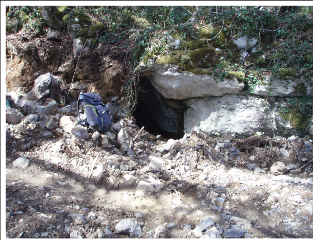
Cueva del Camino 1988 (n° 2080)

Situation : Tocornal, près d'une cabane en ruine.